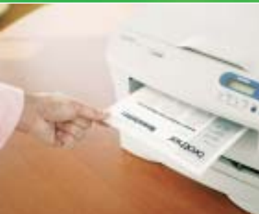
Velocidad de impresión de hasta 20 ppm