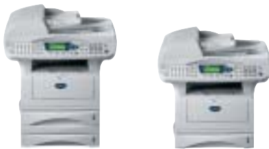
Equipo con bandeja opcional / sin bandeja opcional