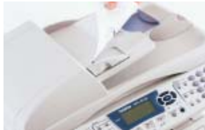
Alimentado automático de originales de 50 hojas Para enviar por fax fácilmente un documento de varias páginas