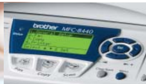
Teclas retroiluminadas de cada función Simplifican el cambio de una función a otra

Y aquí es donde Brother puede ayudar. Trabajando con TCO, la organización que procura un entorno de oficina excelente, un medio ambiente sano y más seguro, Brother está diseñando y desarrollando los equipos de oficinas de forma ergonómica, cuidando la salud de los empleados y protegiendo el medio ambiente.