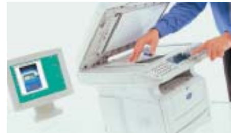
Escáner plano color Para escanear fácilmente documentos encuadernados