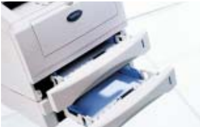
Bandeja opcional (LT-5000) Incrementa la capacidad de papel en 250 hojas

Pero si además, su empresa tiene necesidad de la función de fax, su equipo se encuentra dentro de los modelos MFC.